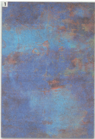
1. 'Sueño de búho'. Óleo y fibra de vidrio.